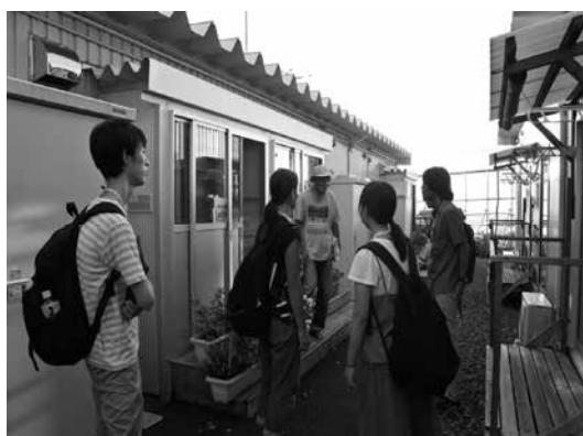
仮設住宅や周辺を案内しながらコミュニティの大切さを説く自治会長(西風道団地)