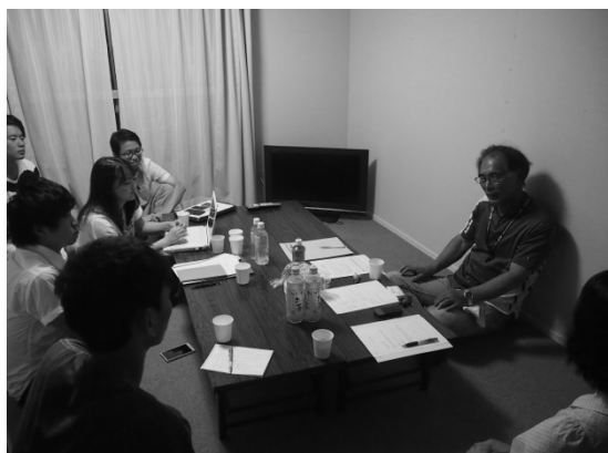
集会所でのインタビュー風景（柳沢団地）