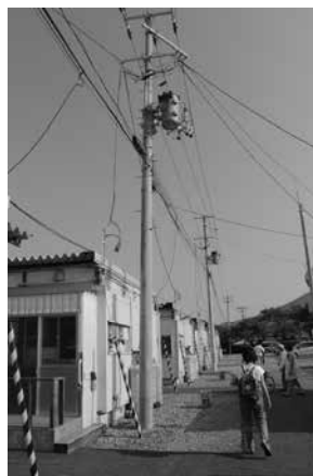
ソケットが落下した電柱