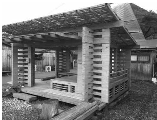
住民らが屋根をつけた「みんなの広場」