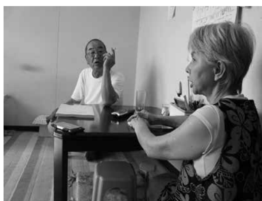
震災で得たものがあると話す自治会長ご夫妻(高畑団地)