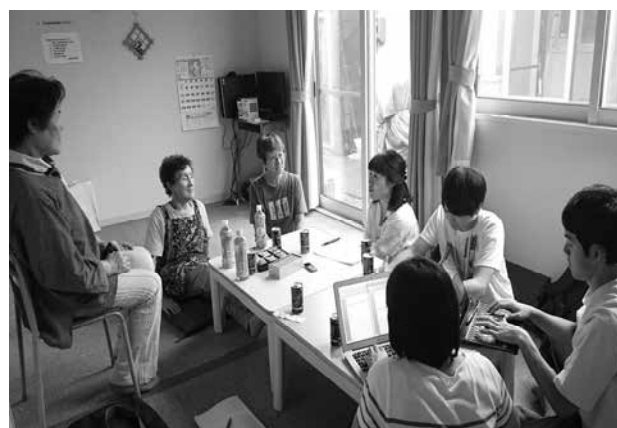
今年から自治会長が女性となって、聴き取りも複数の女性の住民の参加があり、懸命の取り組みを生き生きとお話しくださる（打越団地）