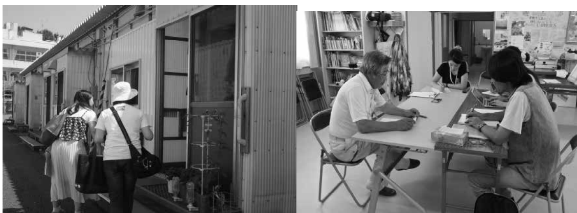
一戸一戸訪ねてのアンケート調査の依頼