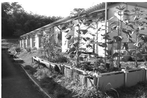
住棟間の土留めのベニアが傾いている (細根沢団地)