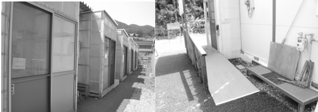
扉に「空き室」の白い張り紙が並ぶ仮設住宅 (要谷団地)