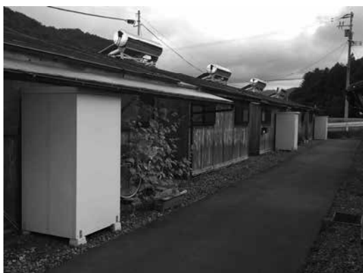
住宅の半数以上が空き住戸