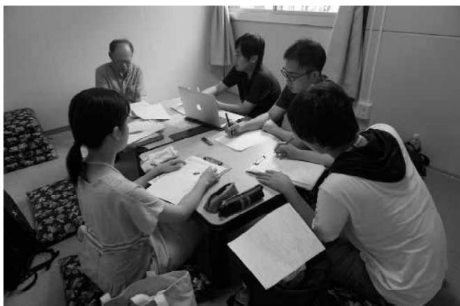
インタビュー風景（横田中学校団地）