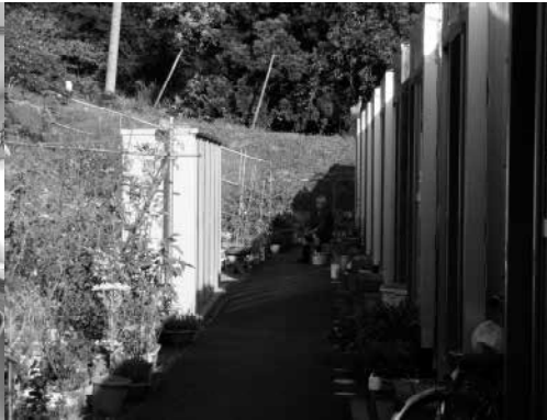
住宅の裏に整備された花壇 (中和野団地)