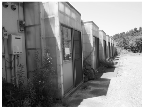
空き部屋を活用した集会所（柳沢）