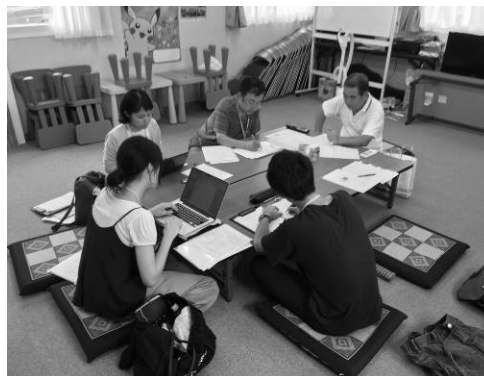
集会所でのインタビュー風景 (下壺団地)