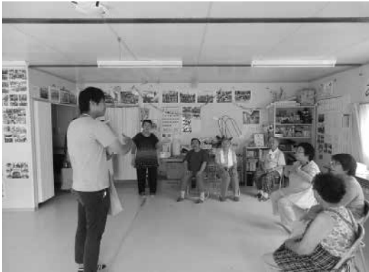
集会所の高齢者の集いでの交流 (高田 1 中団地)