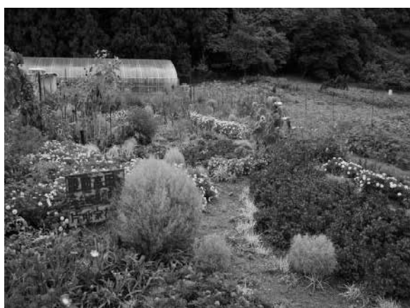
仮設団地に花壇や菜園があり、花や野菜を育てている（片地家団地）