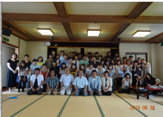
第2期合同調査チームのメンバー