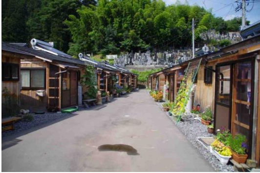
玄関が向かい合う住戸配置（本町）