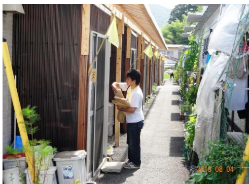
質問票を配布する（諏訪仮設住宅）