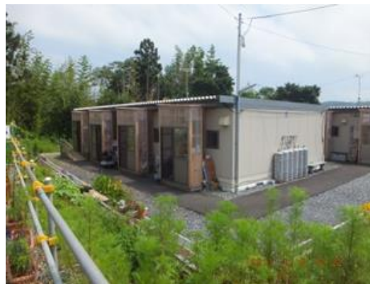
玄関を改良した仮設住宅（三日市）