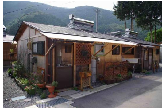
軒先を延ばした仮設住宅（火石）