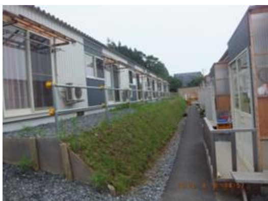
段差をつけた仮設住宅（賤当）

小友町の仮設住宅には小友・高田地区の被災者が多く居住している。「早く仮設から移転したい」と考える住民は多く、そのために「各家庭に応じた具体的な支援策が知りたい」、「大工さん（の賃金）や建築材料も値上がりしている」「小友の建築様式は他地区と異なるので心配だ」など不安を抱えている。中には「移転が決まって心に余裕が生まれた」ものの「自分の家族だけが行っていいのか」と複雑な思いを持つ住民もいる。 (染野享子)