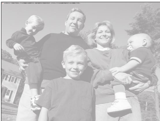
第1期合同調査チームのメンバー

この他、陸前高田の伝統的な祭りである動く七夕、けんか七夕への参加や、住民の皆さんとの交流など、学生にとって都会ではできない貴重な体験となっている。