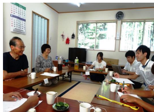
自治会長聞き取り（片地家仮設住宅）